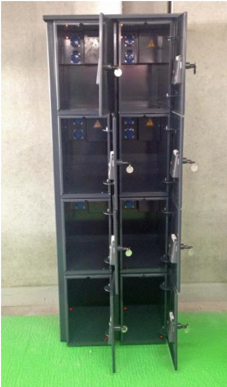
NSA Lockerkast 2x4