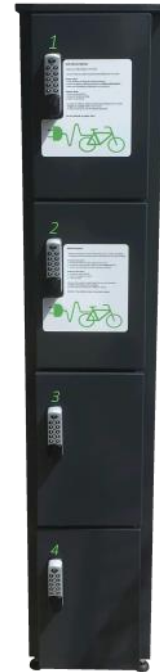
NSA Lockerkast 1x4 Pincode